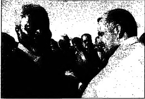
كوفي انان خلال لقائه في مدينة المين مع بعض شخصيات القبول الصحراوية الغربية

مراكش (الشرق الأوسط) - قال كوفي انان، الأمين العام للأمم المتحدة، في بيان له اليوم، إن الطرفين في النزاع في الصحراء الغربية يريدان تطبيق خطة الأمم المتحدة لتسوية النزاع. وأضاف انان في بيان له اليوم، إن الطرفين في النزاع في الصحراء الغربية يريدان تطبيق خطة الأمم المتحدة لتسوية النزاع. وأضاف انان في بيان له اليوم، إن الطرفين في النزاع في الصحراء الغربية يريدان تطبيق خطة الأمم المتحدة لتسوية النزاع.